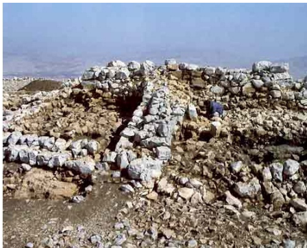
המזבח בהר עיבל.

התכופפה בהתאם לתוואי צדי המזבח. 4 לכן הסיק שהניחו את הערבות על היסוד. על כל פנים, היסוד נמצא רק מצפון וממערב למזבח, אבל לא מדרום וממזרח, ואילו הערבות הקיפו את כל צדי המזבח, ולכן נראה שלפי פשוטה מכוונת המידה "אחד עשר אמה" להנחת בסיס הערבות על גבי הקרקע, ולא על גבי היסוד.